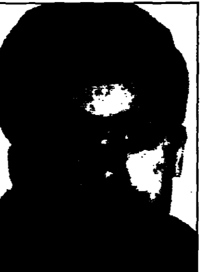
الصحافي الفرنسي شذمان في مؤتمر صحفي في باريس.